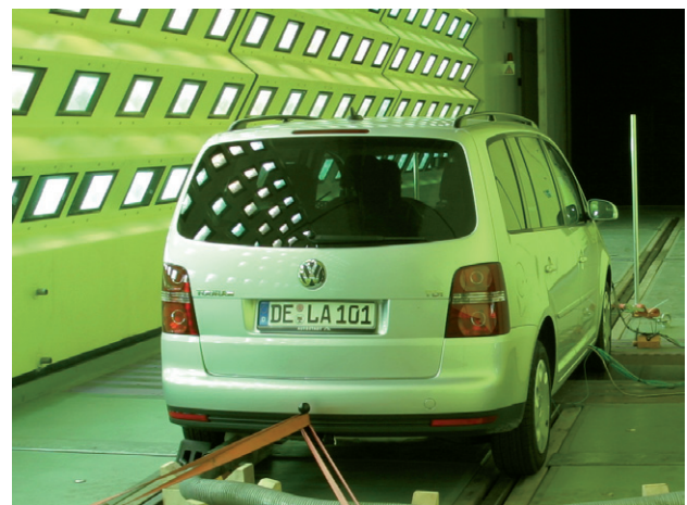
Messungen im Klima-Wind-Kanal

Die Abkühlmessungen im Klima-Wind-Kanal bei der Firma rta in Wien dienten dazu, die neue CO 2 -Klimaanlage so auszulegen, dass sie bei 43°C eine vergleichbare Kälteleistung bereitstellt wie die R134a-Serienklimaanlage. So kann eine Vergleichbarkeit der Messungen beider Anlagen gewährleistet werden.