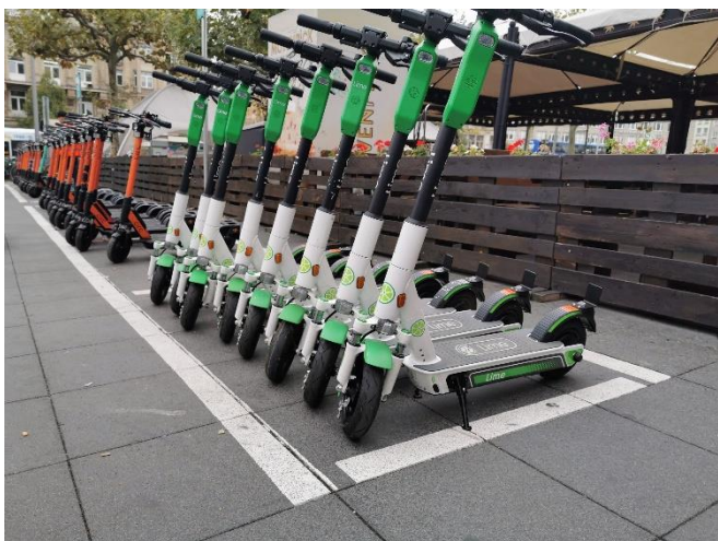
Abbildung 3: Für Batterien aus Leichten Verkehrsmitteln wie z.B. aus E-Scootern muss die Sammelstruktur deutlich verbessert werden, um neue EU-Vorgaben einzuhalten.

Da LV-Batterien bei falscher Entsorgung besonderen Risiken unterliegen und besonders viele Wertstoffe enthalten, sollte Deutschland ein Pfandsystem für diese Batterien etablieren. Auch wenn die EU-Batterieverordnung versäumt hat, eine Grundlage für ein EU-weites Pfandsystem zu etablieren, sollte die Bundesregierung über nationale Best-Practice-Beispiele den Weg für ein Europaweites Pfandsystem für LV-Batterien ebnen.